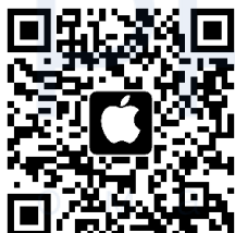
Приложение для iOS

Для управления устройством со смартфона отсканируйте QR-код для загрузки приложения Aroma-Link.