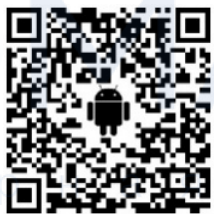
Приложение для Android